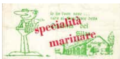
«Adresse storica dal 1970 al 1989