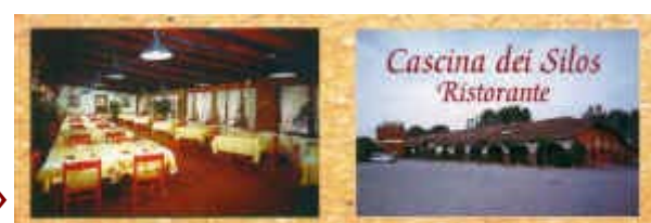
Adresse dal 1990 al 1997 »